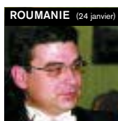
S. Exc. Teodor Baconsky