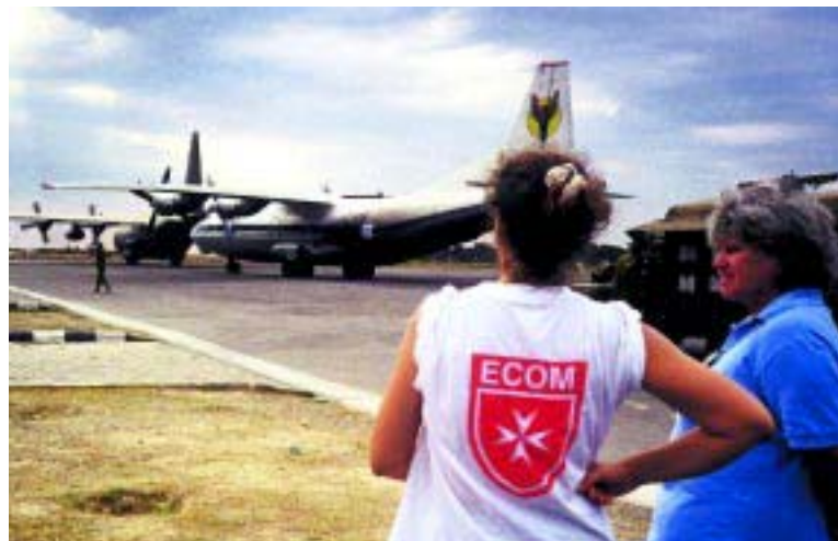
Aéroport de Dili, Timor Oriental. Arrivée d'aide alimentaire d'urgence pour les 300.000 réfugiés fuyant la guerre civile, sous l'œil vigilant d'un volontaire du corps d'urgence de l'Ordre de Malte – ECOM.

Le recrutement des ambassadeurs de l'Ordre se fait, le plus souvent, parmi les diplomates professionnels qui quittent la vie active mais souhaitent offrir leur services pour quelques années, à titre bénévole. Ils sont nommés par le Grand Maître et assurent leurs fonctions dès présentations de leur lettres de créance au Chef de l'État auprès duquel ils sont accrédités.