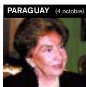
S. Exc. Blanca Zuccolillo Rodriguez Alcalá