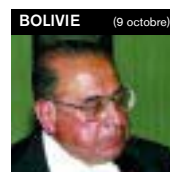
S. Exc. Pedro Rivera Saavedra