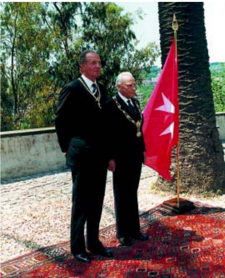
Sa Majesté le Roi Juan Carlos d'Espagne et S.A.E., le Grand Maître de l'Ordre, Frà Andrew Bertie.

et il a organisé à Milan une grande rencontre des Chefs de mission diplomatique des pays européens et africains. Sur le plan interne, la rencontre des Chanceliers et des Secrétaires Généraux des Prieurés et des Associations nationales de l'Ordre s'est révélée très utile.